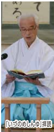
「いづのめしんゆ」拝読