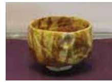
真如茶焼薄茶々碗「木蓮」 出口王仁三郎聖師様