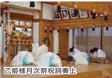
乙姫様月次祭祝詞奏上