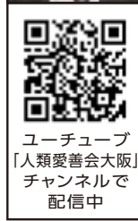
YouTube「人類愛善会大阪」チャンネルで配信中