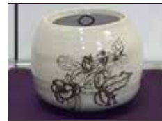
ばら紋 鉄絵 水指 三代教主さま