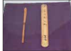
茶杓「とこおとめ」 三代教主さま