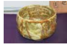
真如楽焼薄茶々碗 「木蓮」 聖師様