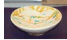
三彩魚文茶碗 出口 尚江 作