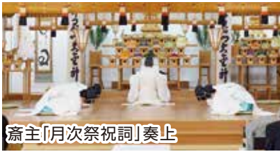
齋主「月次祭祝詞」奏上