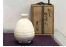
鶴山釜 粉吹徳利 金重素山作