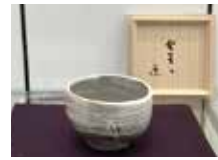
灰釉茶盃「発芽の画」 5代教主様