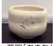
茶碗「おきな」 金重陶陽作 松野奏風絵