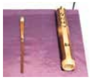
茶杓「なにわづ」 五代教主様

【作】 三代教主様 【作品名】 12ヶ月の歌(1月) ナナメの樹乃濃緑の葉に雪ふれる 暈すきひとり坂のほりゆく (サイズ) H690×W270