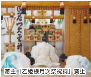
齋主「乙姫様月次祭祝詞」奏上