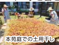
本苑庭での土用干し

松山の梅が例年以上に豊作でしたので、たくさん収穫がありました。直心会では梅エキス、梅干し、梅ジュース、梅ジャムを作ることが出来ました。写真の梅エキス作りと本苑庭での土用干し光景は圧巻でした。しっかりと太陽の光を浴び美味しく仕上がりました。お楽しみに。 コロナ禍の為、皆様にお声がけが出来ず、終始役員のみでの作業となり、なりました。今後の直心会バザーに向けて再び皆様と和やかに作業が出来ます事を願っております。 その節は、どうぞよろしく、お願い致します。