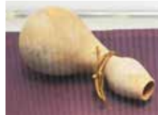
ふくべ花入 金重 有邦