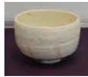
粉引茶碗 五代教主様

【作】 三代教主様 【作品名】 12ヶ月の歌(1月) ナナメの樹乃濃緑の葉に雪ふれる 暈すきひとり坂のほりゆく 【サイズ】 H690×W270