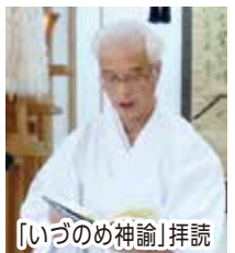
「いづのめしんゆ」拜読