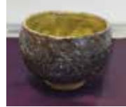
瑞月焼 王仁作茶碗 銘「玉垣」直日