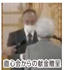
直心会からの献金贈呈