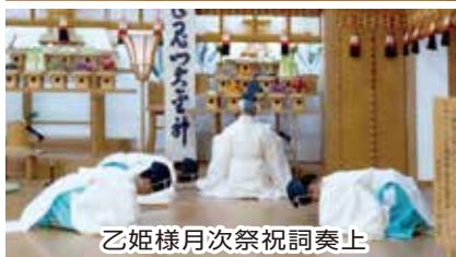
乙姫様月次祭祝詞奏上