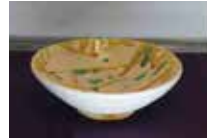
三彩魚文茶碗 出口尚江様