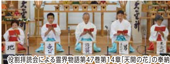
役割拝読会による霊界物語第47巻第14章「天開の花」の奉納

ではないかと思えます。このことがコ ロナウイルス感染症の早期終息にも繋 がると思えますのでよろしく願います 。本日役割拝読奉納をさせていただきました 。盛りが上がっています。お気軽にどしど しご参加いただけますようお願いしま す。又、配信もしておりますので、観られ る環境に無い方はご家族に頼まれて「一 緒に観ていただくのも良いかと思いま す。」と述べた。 午後1時より帰魂。秋のさわやかな一日 となった。 参拝者92名