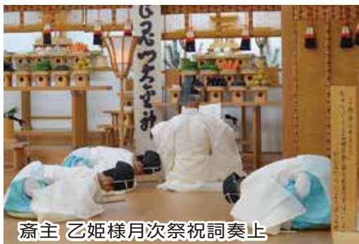
齋主 乙姫様月次祭祝詞奏上