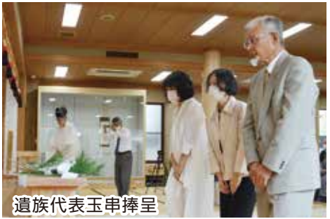
遺族代表玉串捧呈

ことが必要 お祀りさせ 方を丁寧に にられた 三災で犠牲 大三災、小 年に一度は 申し込み、 時慰霊祭を 霊社にも臨 時に、万 の申し込み