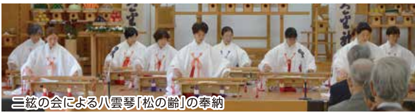
三絃の会による八雲琴[松の齢]の奉納