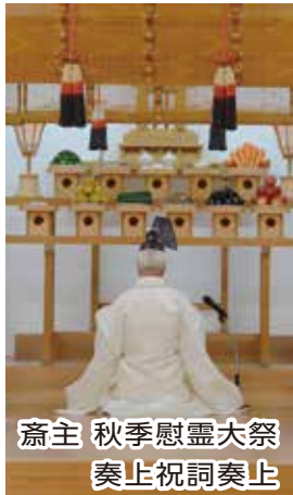
齋主 秋季慰霊大祭 奏上祝詞奏上

本苑長挨拶では、「新型コロナウイルスの影響で縮小しての祭典が続いています。代表参拝の形を取らせていただいておりますが、「離れていても心は一つ」YouTubeを視聴できる方は配信