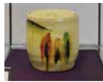
水指 松紋 三代教主様