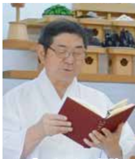
いづのめしんゆ 拝読