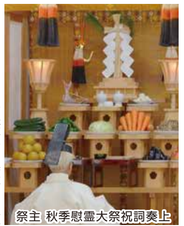
祭主 秋季慰霊大祭祝詞奏上