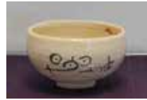
萬寿菊紋 三代教主様絵付 金重陶陽作