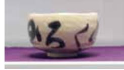
【作 品】茶碗 【名】みろくのよ 【作】二代教主様