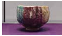
【作 品】耀盤 【作】聖師様