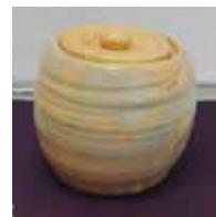
灰釉水指 三代教主様