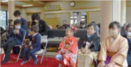
ご神前最前列椅子席で参拝する子どもたち