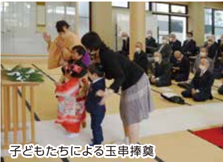
子どもたちによる玉串捧奠

『人型体験談』 人型初干体 御津ノ浜分所岡吉 一二三 これまで、節分大祭は家族と親しい人数人分を分所の人に長年お願いするばかりでした。昨年の節分大祭に下足番のご奉仕にいきませかと、楠田さんによりお誘いを頂き参加させて頂きました。当日、長生殿では教主様をはじめ全国信徒の皆様が全力で一晩中お祈りされている中、瀬織津姫さんが一枚一枚読み上げる姿に感動すると同時に外ではこの大祭の為に多くの信徒の皆様がご奉仕をされている姿を目にし、今までお参りもせずお願いばかりして参りましたがもったいない事をしてきたと反省しました。昨年の感動を思い出し今から一人でも多くの人に難を小難に小難を無難にと、人型に厄を移しその年の災いを祓う大本人型大祓い神事のこと知ってもらいたいと思いで、お誘いに回ったら今年の節分大祭には、こんなにもたくさんの人型を私の手で長生殿にお届けが出来ました。それから何か月もしないうちに不思議