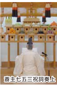
斎主七五三祝詞奏上

紅葉の知らせが北の方から届き始めた令和2年11月8日(日)11月の月次祭が大阪本苑で執行された。祭典は伶人入場、祭員入場、祓式行事、斎主による月次祭祝詞奏上、続いて七五三祝詞、新型コロナウイルス早期終息祈願祝詞が奏上された。玉串捧奠は、斎主、総代会代表、宣伝使代表、分所支部代表、参拝者誕生者代表等が敬虔にささげた。七五三の子供たちは家族に伴われ恥ずかしそうに捧奠した。神言奏上、讚美歌斉唱、引き続き乙姫様月次祭が行われた。祭員伶人退場。足立正文宣教担当参事による「おほもと神諭」を拝読し祭典は終了。