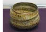
灰釉茶碗 五代教主様